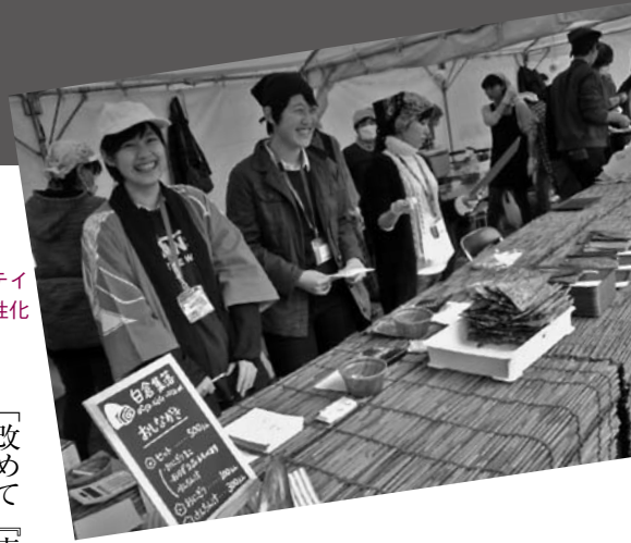
公務員ビジネス学科では万代シティのPR事業に参加し、商店街の活性化に取り組んでいる